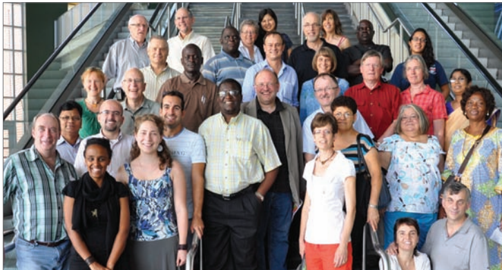
Líderes del CMM en un recorrido por el Complejo Farm Show, en Harrisburg, Pennsylvania, EE.UU., lugar de la Asamblea 2015.