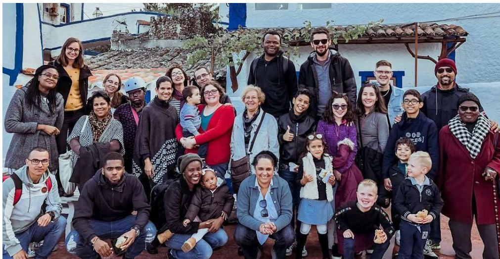
Une rencontre de la paroisse de Loures

Notre union d'églises prie pour trouver de nouveaux pasteurs pour cette église qui va certainement devenir plus multiculturelle à l'avenir pour renouveler sa vision et renforcer leur capacité de croire ! Nous vous demandons donc de prier pour que nous trouvions un couple pastoral pour cette assemblée !